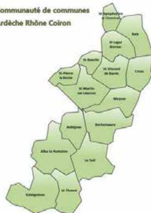
Communauté de communes Ardèche Rhône Coiron

Dans l'attente d'un site internet unique «Ardèche Rhône Coiron», les deux sites restent en fonctionnement. Sur chaque site internet, vous continuerez à trouver dans la rubrique «la communauté / compte-rendus conseils» les compte-rendus et délibérations prises lors des conseils de Ardèche Rhône Coiron.